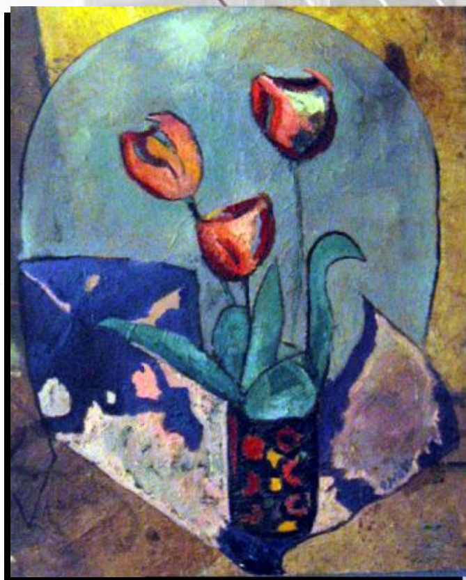
ORLOVA Liubov, « Les tulipes », huile sur toile