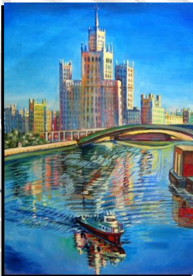
Nina SILAEVA, « Vue de Moscou », huile sur toile

Vernissage le 15 septembre en présence des artistes Couleurs de Russie