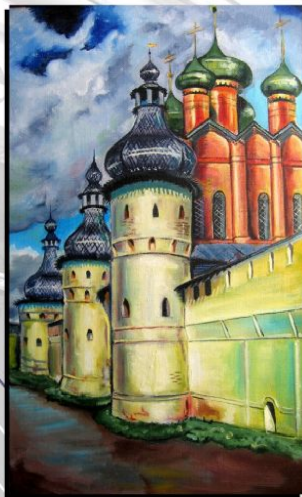
Silaeva Nina, « Rostov Veliki », huile sur toile

Née en 1963 et diplômée de l'université des arts de Moscou, Nina Silaeva a su intelligemment utiliser ses deux casquettes de peintre et de designer pour proposer une vision personnelle et moderne du monde qui nous entoure. Elle se distingue de ses contemporains par son style post-réaliste socialiste à la fois ancré dans la tradition des paysagistes russes et dans le respect des codes imposés par le régime soviétique. L'artiste redonne à la figuration ses lettres de noblesse notamment à l'aide d'une palette flamboyante et éclectique. Elle a su s'imposer sur la scène russe contemporaine grâce à sa virtuosité dans la représentation qui offre ainsi un voyage au plus profond de ses émotions à travers des paysages urbains à la fois lumineux et énigmatiques, du fait de l'absence de présence humaine