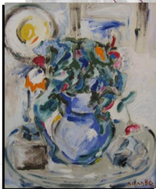
Orlova Liubov, « Bouquet », huile sur toile

C'est parce qu'elle ressent ce qu'elle touche et qu'elle est ce qu'elle peint que la créatrice parvient à faire de son monde un langage visuel accessible par tous. Toutes ses particularités lui ont permis d'asseoir sa renommée et son individualité à l'échelle internationale. Elle a ainsi su faire de son nom une référence en matière d'art contemporain russe.